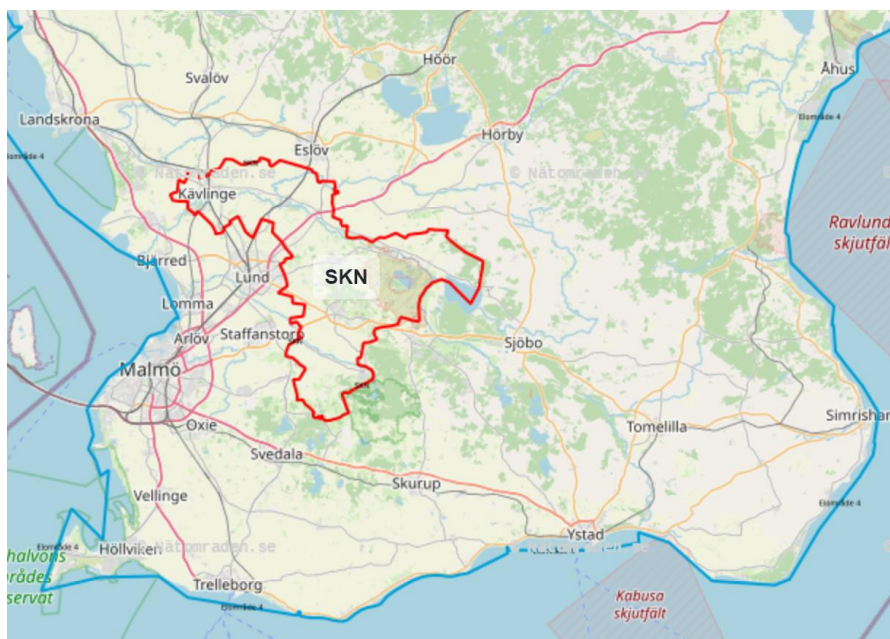
Figur 1: Karta över SENAB:s nätområde som i denna plan utgör ett delområde