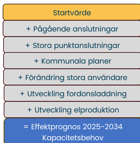
Figur 2: Uppbyggnad av modell för effektprognos

SENABs prognosmodell följer till stor del den modell som beskrivs i Effektprognoser för lokalnät – Effektprognos – en lathund för lokalnätsbolag | ( energiforsk.se )